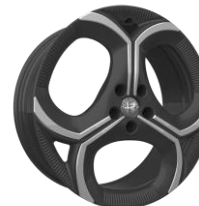
WSS - 20" Fori