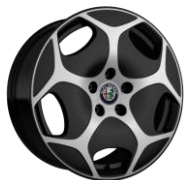
WAC - 17" Aero