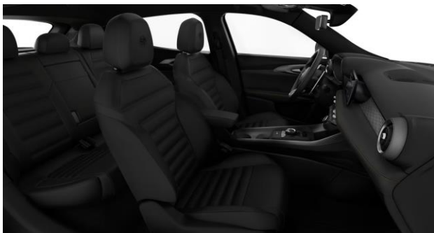
Geperforeerd zwart lederen bekleding met grijze stiksels Standaard op Ti en Veloce