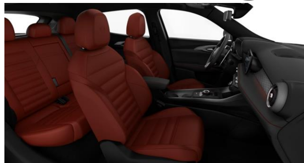
Geperforeerd rood lederen bekleding met rode stiksels Optioneel op Ti en Veloce