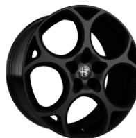
2VZ - 19" Stile