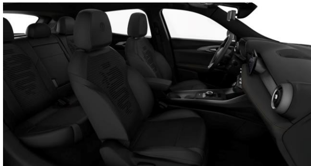
Zwarte stof/technoleder Standaard op Tonale