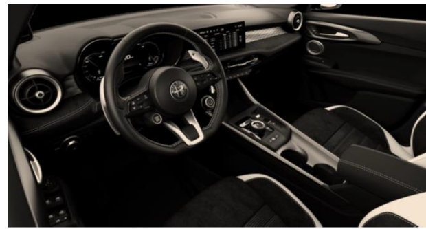
Alcantara zwart/witte bekleding met witte stiksels Standaard op Sport Speciale