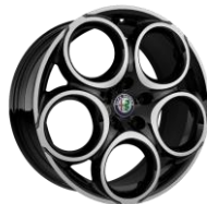
WFL - 18" Petali