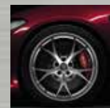
Jantes alliage 19" Leggera