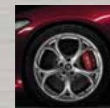
Jantes alliage 19" Quadrifoglio