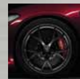
Jantes alliage 19" Leggera Scuro