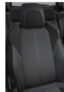
Tapicerka półskórzana Belomka Mistral