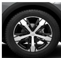
18" 'Los Angeles'