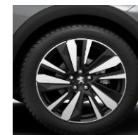
19" 'San Francisco'