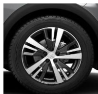
18" 'Detroit' Onyx Black