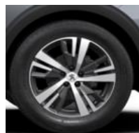
18" 'Detroit' Storm Grey