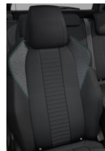
Tkanina Pneuma Mistral