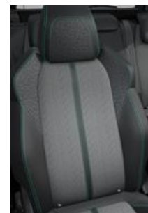
Tapicerka półskórzana Colyn Mistral